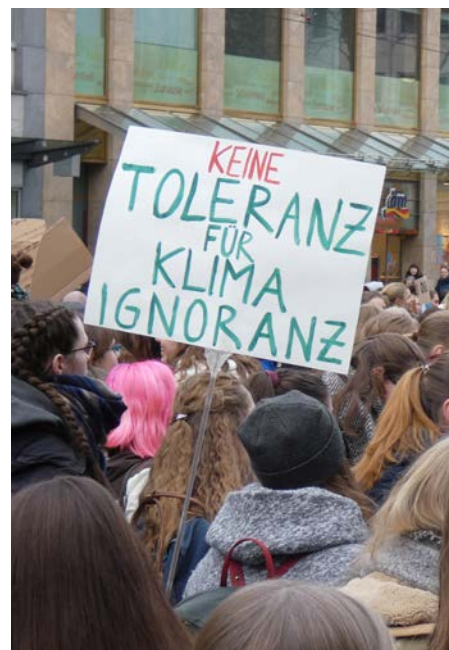
AUCH IN KASSEL GEHEN SCHÜLERINNEN UND SCHÜLER FÜR KLIMASCHUTZ AUF DIE STRASSE.

Die Initiative „Erklärung der Vielen“, mit der sich viele Künstlerinnen und Künstler für die Freiheit der Kunst und gegen Angriffe von Rechten auf Kulturinstitutionen einsetzen, hat Thorsten Schäfer-Gümbel gelobt. „Vor hundert Jahren wurde in der Weimarer Verfassung die Kunst- und Kulturfreiheit verankert. Die Freiheit von Kunst und Kultur ist heute wieder Angriffen, größtenteils aus dem rechten Spektrum, ausgesetzt. Diese reichen von Anträgen auf Entziehung von Zuschüssen bis zu Morddrohungen. Diesen Angriffen stellen wir uns entschieden entgegen.“